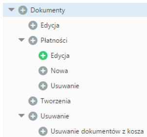
Fragment drzewa uprawnień systemowych - Dokumenty

Oprócz podstawowych uprawnień do dokumentów, w systemie eDokumenty obowiązują: