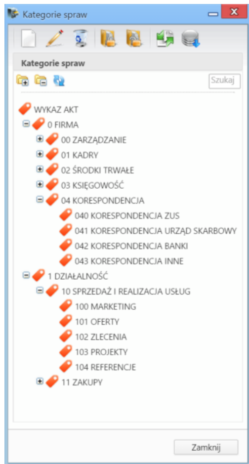
Panel zarządzania kategoriami spraw (teczkami)

Kategorie spraw możemy utożsamić z Wykazem akt. Mają one strukturę drzewa, które możemy rozbudowywać o dowolną ilość podkategorii. Do zarządzania kategoriami wykorzystujemy Pasek narzędzi .