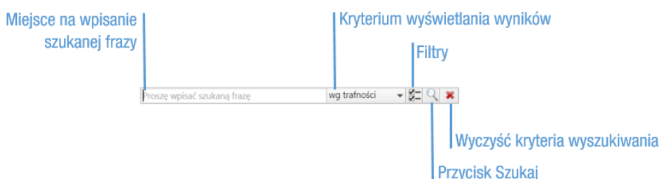
Rysunek 1: Wyszukiwarka globalna

Wyszukiwarka zaawansowana dostępna jest po kliknięciu w Panelu bocznym pozycji Szukaj lub - jeśli uprawnienia na to pozwalają - w Pasku wtyczek . Działanie wyszukiwarki opisano na Rysunku 1 .