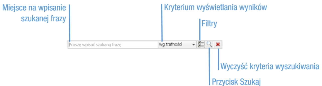
Rysunek 1: Wyszukiwarka globalna

Dostęp do Wyszukiwarki zaawansowanej uzyskujemy