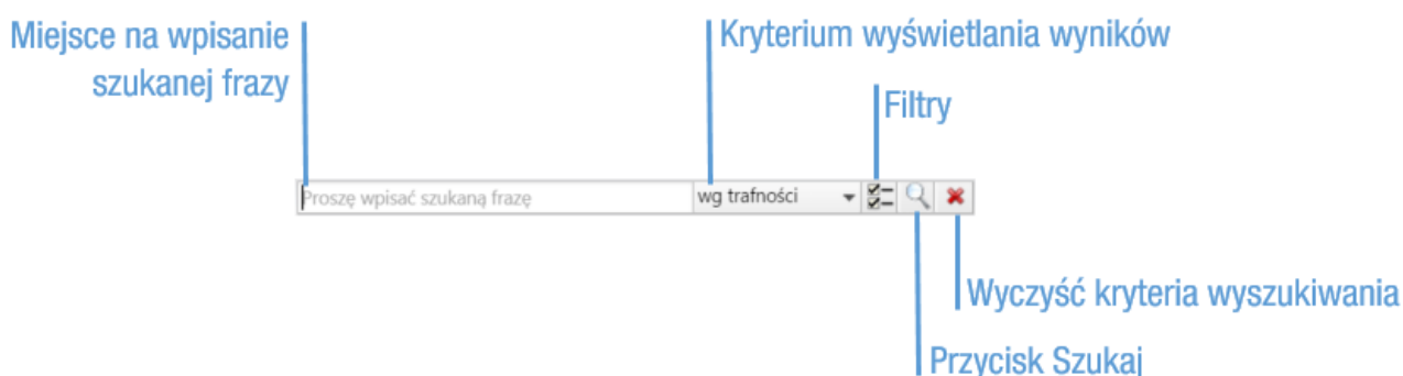
Rysunek 1: Wyszukiwarka globalna

Dostęp do Wyszukiwarki zaawansowanej uzyskujemy