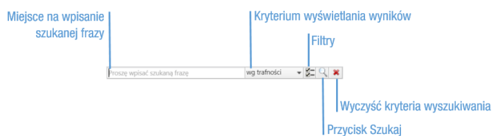
Rysunek 1: Wyszukiwarka globalna