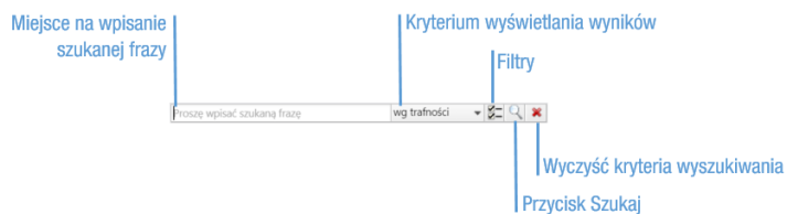
Rysunek 1: Wyszukiwarka globalna