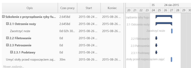
Przykładowy wykres Gantta w sprawie