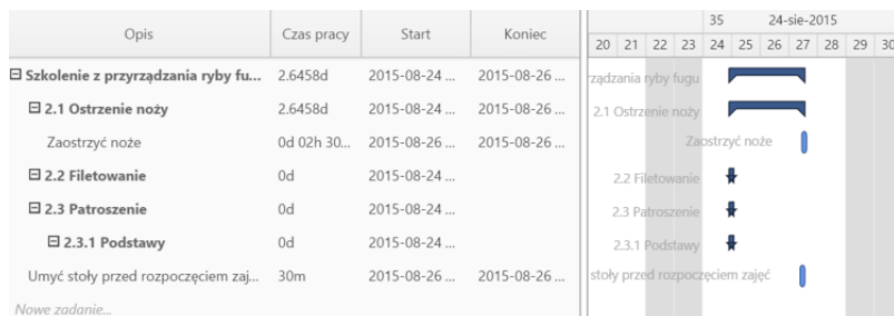
Przykładowy wykres Gantta w sprawie