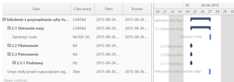
Przykładowy wykres Gantta w sprawie