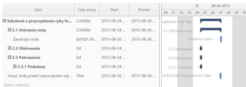
Przykładowy wykres Gantta w sprawie