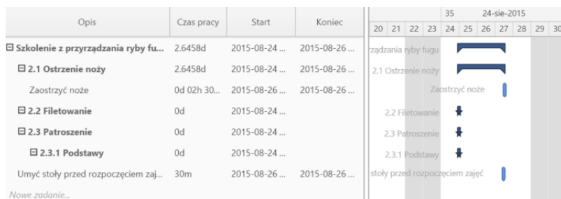
Przykładowy wykres Gantta w sprawie