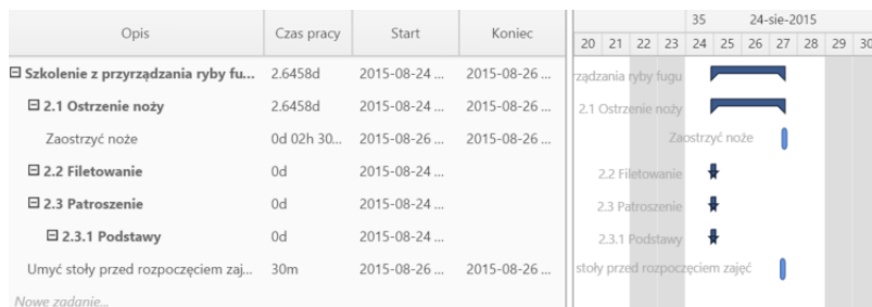
Przykładowy wykres Gantta w sprawie