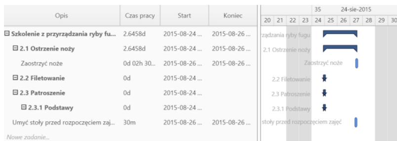
Przykładowy wykres Gantta w sprawie