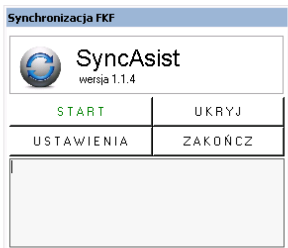
Okno programu SyncAssist

Jak widać na powyższym rysunku dostępne są cztery opcje: